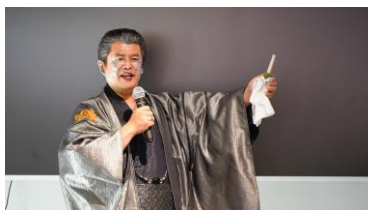
防災落語『防災寿限無』