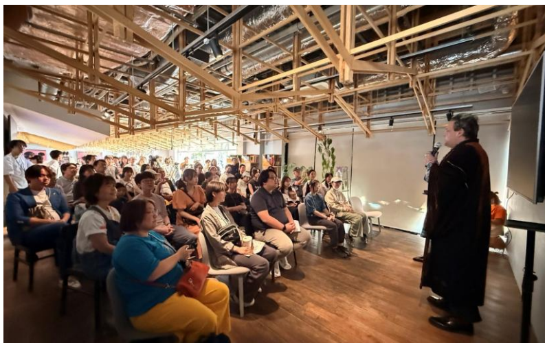
オープニングアクト | 桂三輝氏による落語。超満員の会場が沸いた。

オープニングアクトは、ブロードウェイや浅草での公演で大好評を博す桂三輝(かつら サンシャイン)氏による落語。会場は一気に爆笑の渦に包まれました。その直後、空気はクールに一変ーランウェイによる5章立てのストーリーが幕を開けます。