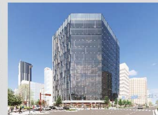
04 (仮称)錦三丁目5番街区計画