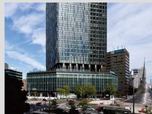
01 大名古屋ビルディング