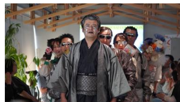
第二幕フィナーレ