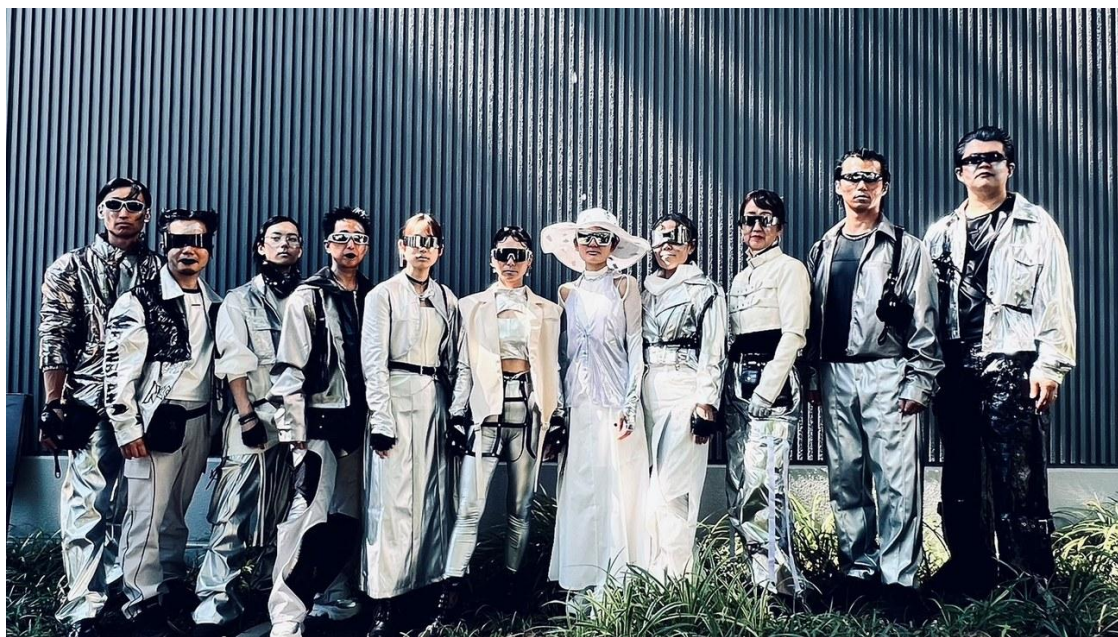
TOKAI VIVID (美備人) —イキイキと、美しく“備える”人たち

2026年5月30日(土)、名古屋・久屋大通公園内のFab Cafe Nagoyaにて、「あいちフューチャーフェス2026」の一環として、防災ファッションショー『防災コレクション』と『防災落語』を開催しました。本イベントは「防災をカッコよく」をテーマに、普段から真剣に防災へ取り組む専門家たちが、本気でファッションナブルな衣装を身にまといランウェイを歩く、これまでにない試みです。