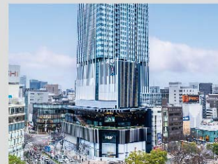
03 ザ・ランドマーク名古屋栄